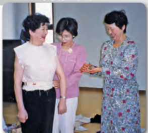
会員による研修会