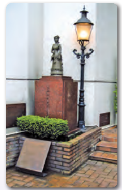
洋裁業 発祥記念碑