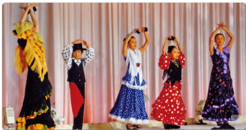
2009 my fashion フラメンコ