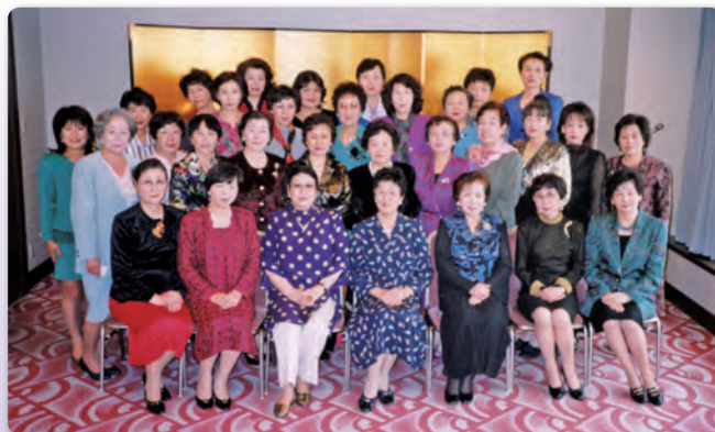
15周年記念パーティー