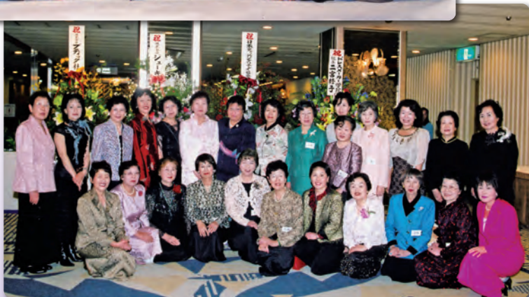
△創ing 2005 My Fashion