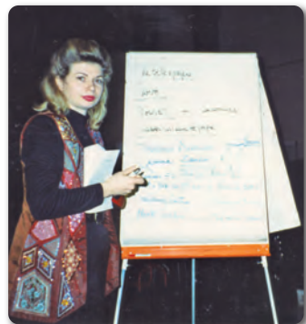
エスモード・パリ校 教授