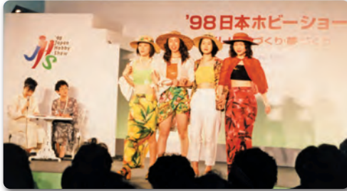
'98日本ホビーショー