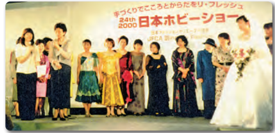
2000(24th)日本ホビーショー