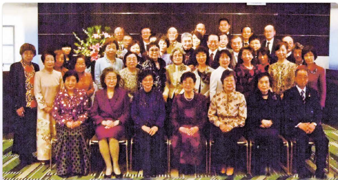
第30回総会 京王プラザホテル (H24.1.20)