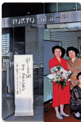
▽創ing '90 My Fashion