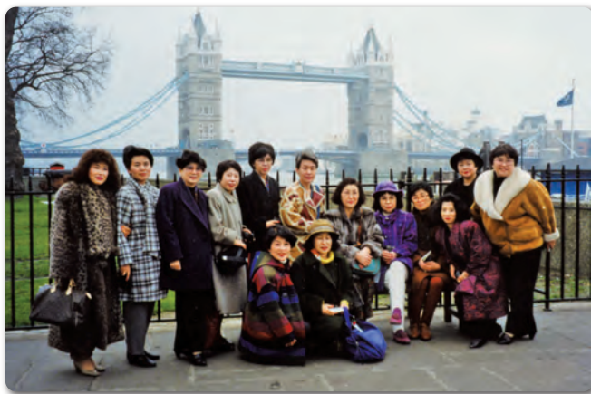
海外研修旅行 ロンドン