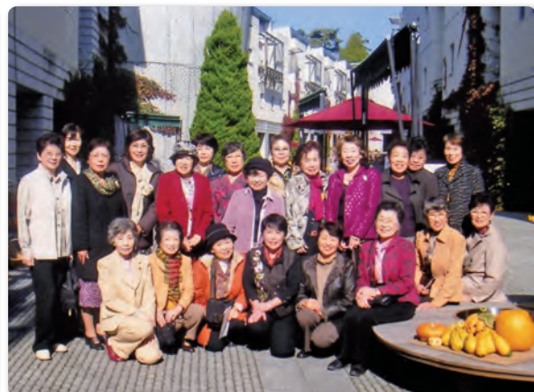
リゾナーレ小淵沢