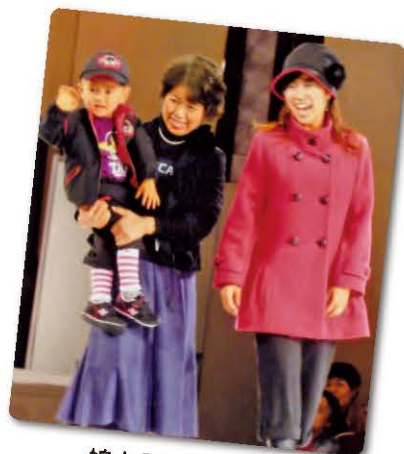
娘と孫とフィナーレに