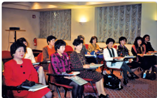
イタリア マランゴ二校のセミナー