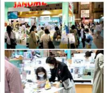
昨年の会場(他企業ブース、ワークシヨップの様子)→