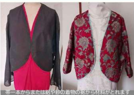
帯一本からまたは絡や紗の着物の裾から材料がとれます

ポレロ風ジャケット(ワークシヨップ用) ※ご準備のお願いはありません 様々な和風の生地を裁断し準備します。簡単な縫い合わせと端始末で洋服を作ることができる体験です。