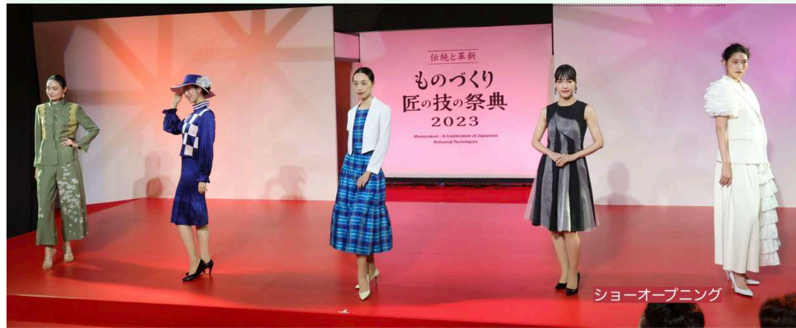
ショーオープニング