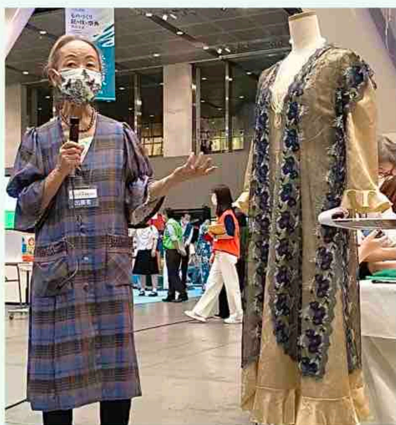
インタビューも配信されました

「オートクチュールコレクション ションタクミジヤパン2022」で、お楽しみいただけますので、今後とも会員の皆様には奮ってご参加いただけますよう、よろ