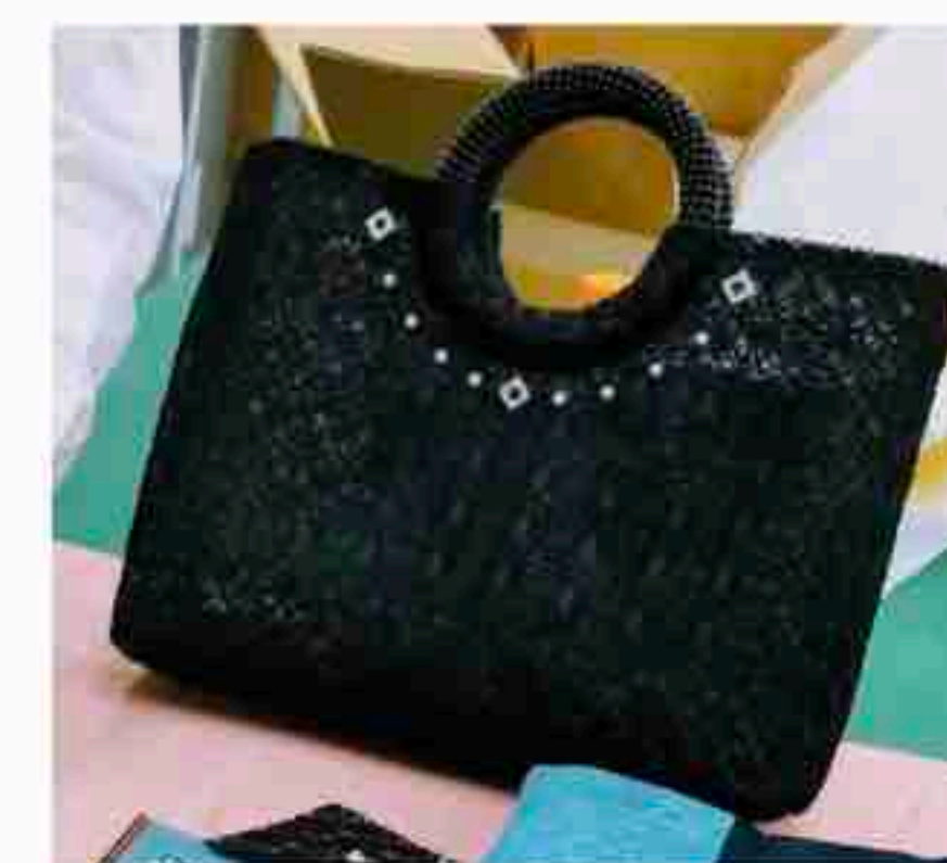
張りがあるメッシュ 生地バッグを キラキラでアレンジ

パールやキラキラパーツでアレンジ できる簡単な機械の紹介がありまし た。小物をはじめ洋服のパーツのア レンジが楽しめそうです。詳しくは インター ネット検索 「リベリー ノ」で。