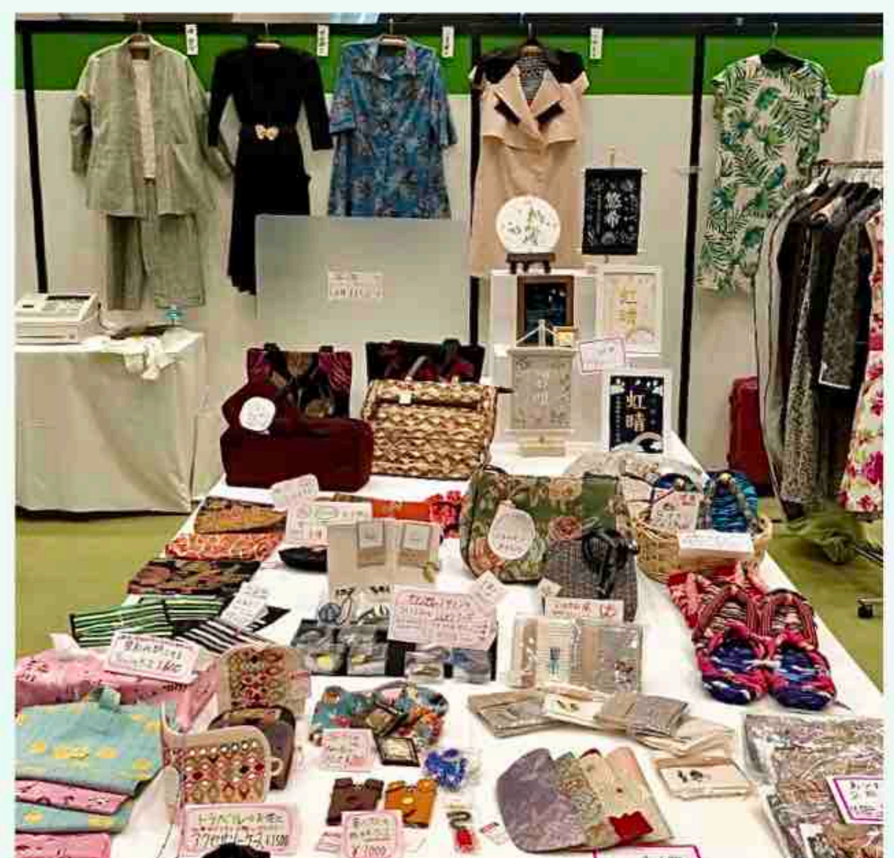
作品展示、小物販売はPOPでアピール

また、出展ブースでは作品展示・販売、東袋の体験プログラムを行いました。東袋は、短時間での完成度の高さに、年齢を問わず人気体験プログラムとなっております。これからもJFCAの体験プログラムとして継続させていきたいと思っております。引き続き、会員の皆様には生地材料(四方巻きロック)のご協力のほど、よろしくお願いいたします。