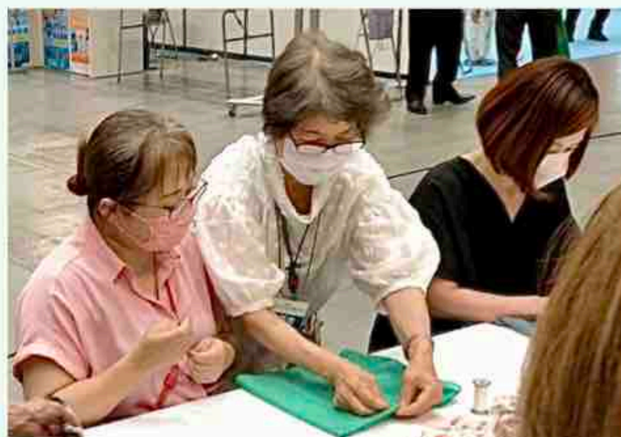
体験プログラムも盛況です

また、出展ブースでは作品展示・販売、東袋の体験プログラムを行いました。東袋は、短時間での完成度の高さに、年齢を問わず人気体験プログラムとなっております。これからもJFCAの体験プログラムとして継続させていきたいと思っております。引き続き、会員の皆様には生地材料(四方巻きロック)のご協力のほど、よろしくお願いいたします。