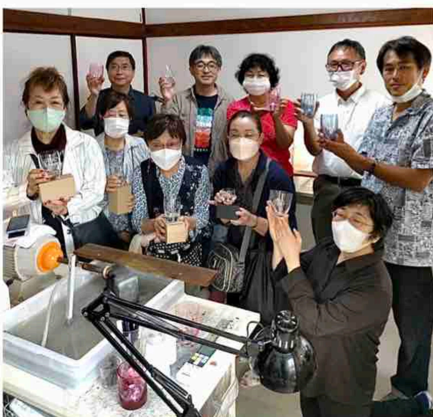
技能士の方々と完成したマイグラスを手に ※「創吉 切子体験教室」 お問合せ TEL : 03-6802-8948

用意されている沢山の模様見本 は、伝統和柄だけでなく現代的なか わいいイラストもありました。基本 は線で、その太さや長さ組み合わせ で模様が出来ています。グラスを削 りすぎて穴を開けないように気をつ けながらグラインダーで模様を削る 練習をしました。参加者は「日本酒 グラスやビールグラス」など考えな がら楽しく伝統技を体験しました。 どなたでも常時申し込みできます。